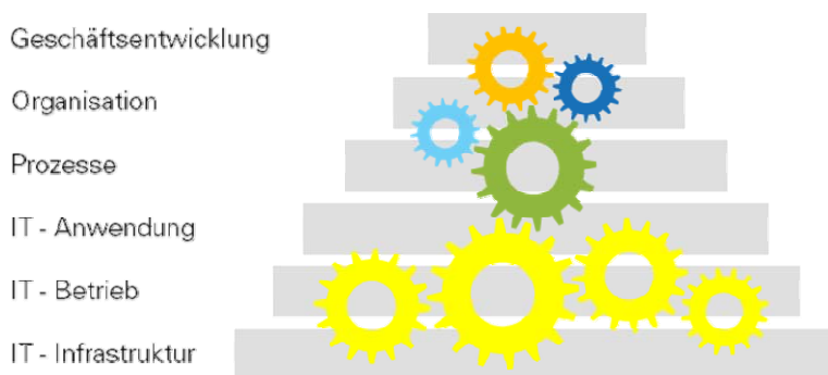
Abb.: Unsere Analysen, Konzeptionen und Umsetzungen sind ganzheitlich!

Für unsere Beratungsmandate bündeln wir unsere Kompetenzen, Erfahrungen und Persönlichkeiten, arbeiten interdisziplinär, geschäftsbereichsübergreifend, flexibel, vernetzt und handeln lösungs- und kundenorientiert.